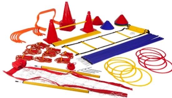
Diverse Trainingsmaterialien ab 15 €