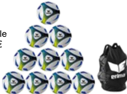
Fußbälle ab 20 €