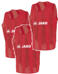
Trainingshemdchen ab 5 €