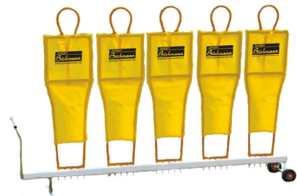
Freistoßmauer-Figuren ab 75 €