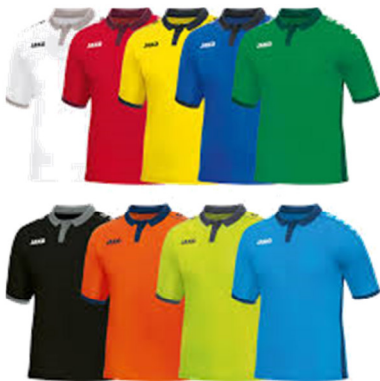
Satz Fussballtrikots ab 300 €