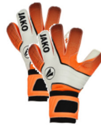
Torwarthandschuhe ab 25 €